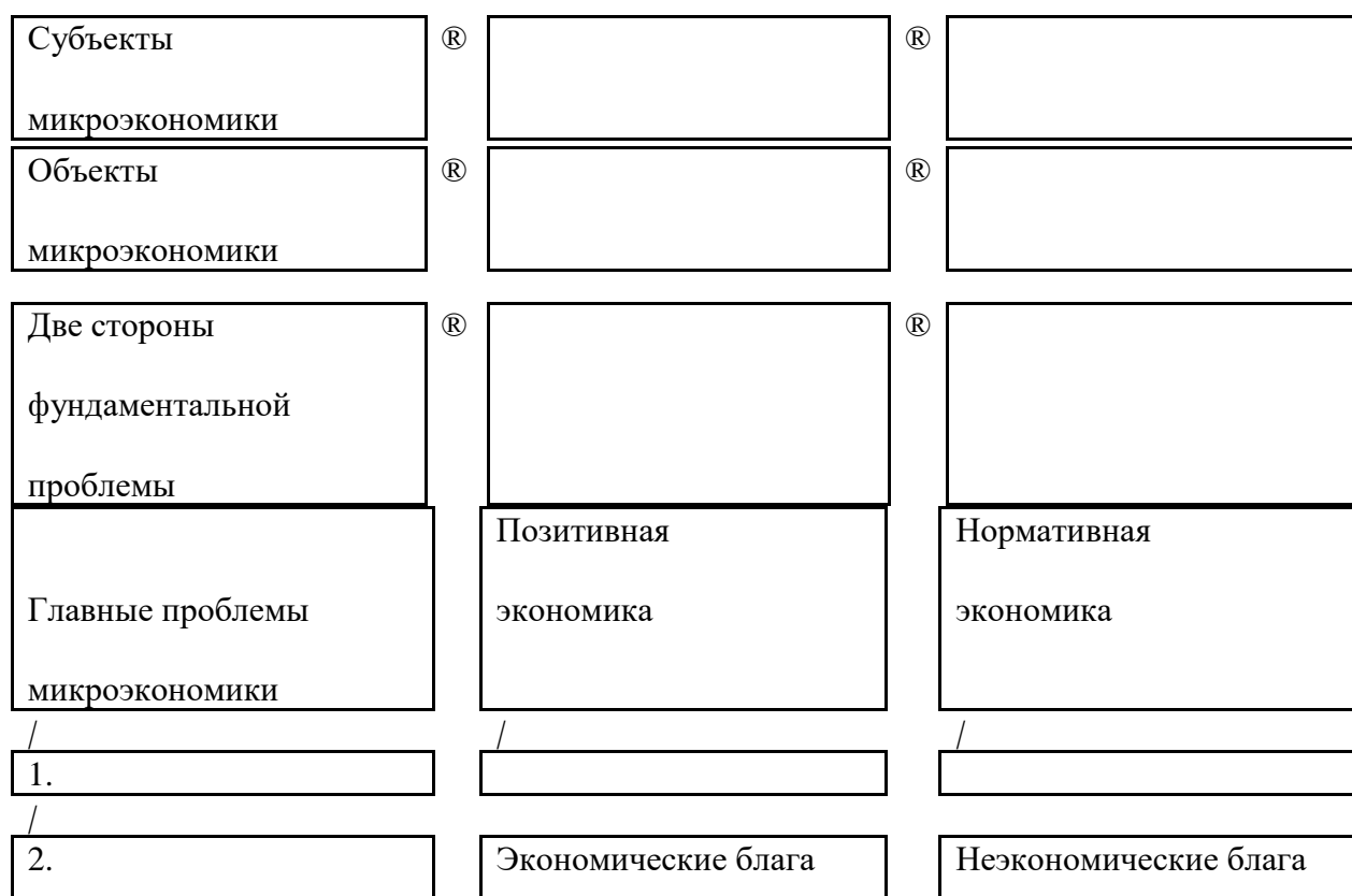
Рис.1. Блок-схема «Введение в микроэкономику»

4. В приведенной блок-схеме «Введение в микроэкономику» проследите взаимосвязь между экономическими понятиями